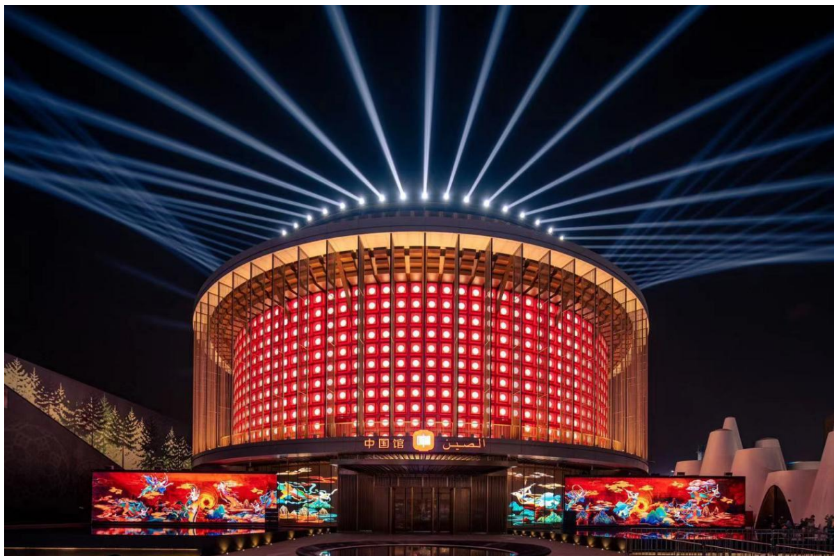
迪拜世博会中国馆“华夏之光”主题灯光展演

公司大型文化演艺活动业务除继续在国家级重大项目上发力外，积极拓展商业演出领域。报告期内，公司参与制作梦圆东方 2021-2022 东方卫视跨年盛典、第九届中国秦腔艺术节活动等商业演出活动，在商业演出领域进一步继续发力。