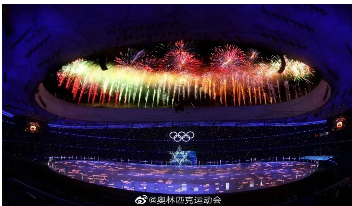
2022 年北京冬奥会闭幕式

报告期内，公司实现大型文化演艺活动业务营业收入 13,377.65 万元，比去年增长 20.02%。2022 年 2 月，公司圆满完成了 2022 年北京冬奥会开幕式灯光设计及制作、2022 年北京冬奥会闭幕式及残冬奥开幕式的创意设计及服务。董事长沙晓岚作为北京冬奥会闭幕式导演，以“一片雪花的故事”为线索，讲述“世界大同，天下一家”的主题，体现奥林匹克“更团结”的理念。